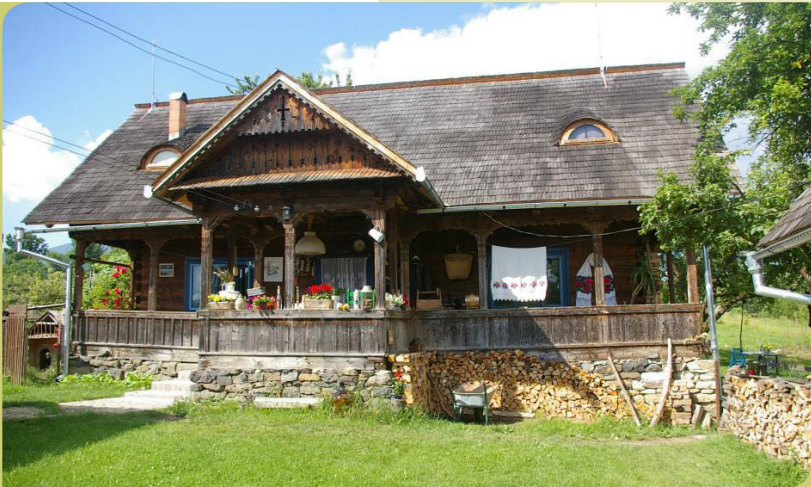
ფოტო 01. საოჯახო სასტუმრო სოფელ ბრეშში, მარამურეს რეგიონი, ჩრდილოეთი რუმინეთი. ტრადიციული რუმინული ხის სახლი, ხის გადახურვით.

უსაფრთხოების კუთხით სასურველია შენობას ჰქონდეს ორი გასასვლელი, რათა ადვილად მოხდეს მისი ევაკუაცია. თუმცა ტრადიციულად მთის საცხოვრებელი სახლები სითბოს მაქსიმალურად შენარჩუნების მიზნით მცირე კარ-ფანჯრიანი იყო. ასეთი სახლების საოჯახო სასტუმროებად განვითარების შემთხვევაში მიზანშეწონილი იქნება წინასწარი ზომების მიღება და ქცევის წესების განსაზღვრა ხანძრის პრევენციისთვის. ასევე მნიშვნელოვანია ობიექტისთვის შემუშავებული იქნეს ხანძარსაწინააღმდეგო სისტემა (ცეცხლმაქრი საშუალებები, კვამლის დეტექტორები, ავარიული განათება) საევაკუაციო გეგმით, რათა განსაზღვრული იყოს სად არის ყველაზე დიდი საშიშროება ხანძრის წარმოქმნის და როგორ უნდა მოხდეს მისი სწრაფი აღმოფხვრა.