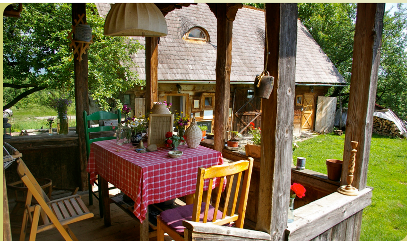
ფოტო 02. საოჯახო სასტუმრო სოფელ ბრეზში. შენარჩუნებული ხის აივანი.